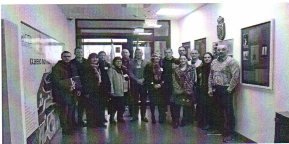
Посета тима НПМ КПЗ Панчево

Током извештајног периода НПМ је обавио прву редовну посету Казнено-поправном заводу у Панчеву, која је била дводневна, а током које је контролисано комплетно стање у установи у погледу поштовања права лица лишених слободе. О обављеној посети сачињен је Извештај 32 у којем је НПМ похвалио примере позитивне праксе у поступању према лицима лишеним слободе у овој установи и упутио четири препоруке за отклањање недостатака и даље унапређење поступања. По свим упућеним препорукама Завод је поступио у року.