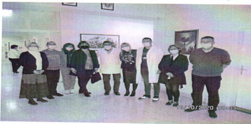
Посета НПМ тима СБПБ „Свети Врачеви“ у Новом Кнежевцу

Тематски извештај НПМ из ових посета биће упућен у 2021. години, те ће налази из ових посета бити представљени у Годишњем извештају НПМ за 2021. годину.