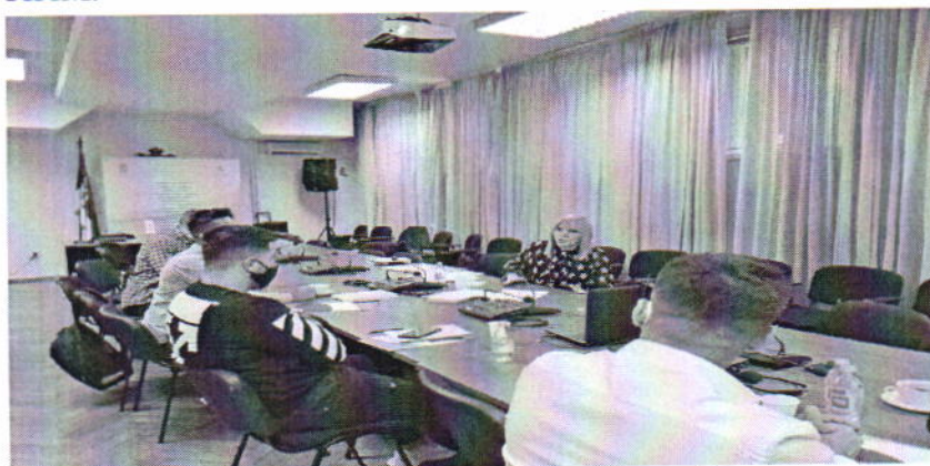
Вршњачки едукатори са заменицом заштитника грађана

Представници НПМ су на Светски дан детета у сарадњи са Центром за кризну политику и реаговање, Данским саветом за избеглице и Центром за истраживање и развој друштва ИДЕАС, организовали радионицу за малолетне мигранте без пратње, током које су представљене надлежности, мандат, значај и улога Заштитника грађана и НПМ.