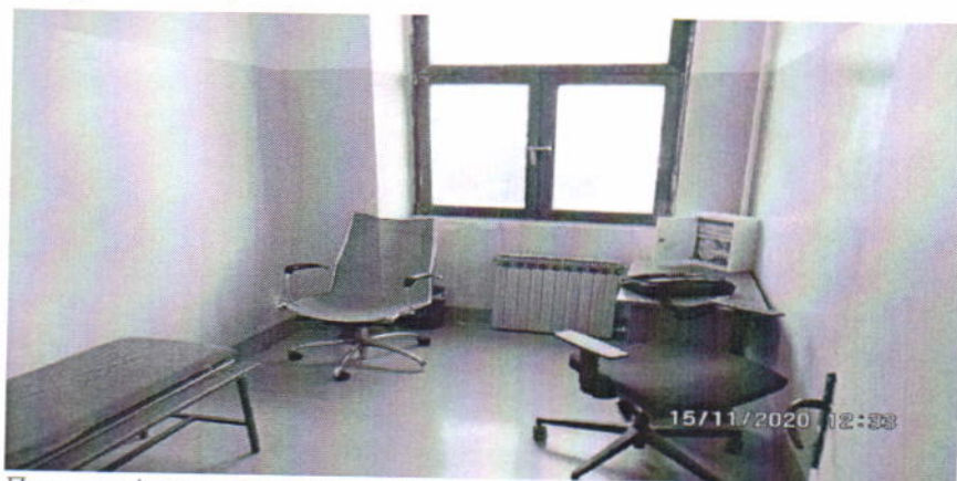
Просторија за лекарски преглед задржаних лица у седишту ПУ за град Београд

Решења о задржавању у које је тим НПМ остварио увид током ових посета су уручивана задржаним лицима благовремено, односно убрзо након отпочињања задржавања, што су лица својим потписом потврђивала. Такође, приметно је да се лекарски извештаји, односно медицинска документација, по правилу дају задржаном лицу и не одлажу у предмет о задржавању. Уочено је и да се свим лицима која затраже медицинску помоћ пре или током задржавања иста и омогућава, као и да се у мањим срединама, сва лица пре задржавања прегледају од стране лекара, како би исти дао мишљење о томе да ли је лице способно за задржавање. У већем броју посећених полицијских станица полицијски службеници присуствују лекарском прегледу из безбедносних разлога, јер медицинско особље то захтева, али ту чињеницу и своје присуство писмено не констатују. С тим у вези, НПМ је у извештајном периоду упућивао препоруке у циљу унапређења поступања у овом делу. Најзад, охрабрује чињеница да обиласком канцеларија криминалистичких инспектора, у канцеларијама и орманима у највећем броју полицијских станица нису затечени нестандартни и/или необележени предмети из кривичних дела.