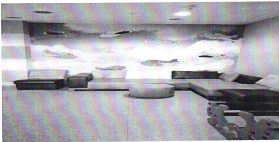
Просторија за мајке са децом којима је одбијен улазак у земљу на аеродрому „Никола Тесла“

услова у којима бораве особе у транзитној зони, с обзиром на то да су радови на реконструкцији Аеродрома укључили и изградњу нове просторије за смештај странаца којима је одбијен улазак у земљу, а која ће бити у складу са важећим стандардима. Такође, поступајући по препоруци НПМ Станица граничне полиције Београд на Аеродрому „Никола Тесла“ је на видном месту у просторији у коју се смештају лица којима је одбијен улазак у Републику Србију истакла контакте релевантних домаћих и међународних организација које овим лицима пружају помоћ у остваривању њихових права.