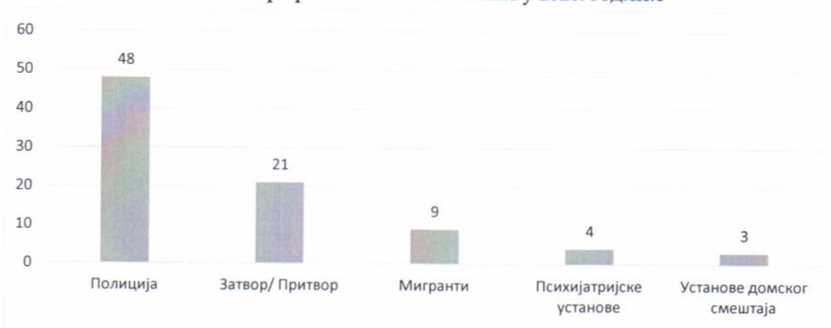
Графикон 1 - Посете НПМ у 2020. години

Током извештајног периода, НПМ је обавио 85 посета установама у којима се налазе или се могу налазити лица лишена слободе. Обављено је 48 посета полицијским станицама 12 , 21 заводима за извршење кривичних санкција 13 , три установама социјалне заштите домског типа 14 , три психијатријским установама 15 , а посећена је и Специјална затворска болница у Београду. Такође, обављено је девет посета у циљу праћења поступања према избеглицима и мигрантима 16 . НПМ је у извештајном периоду пратио и поступање полиције током јавних окупљања грађана у Београду у јулу месецу.