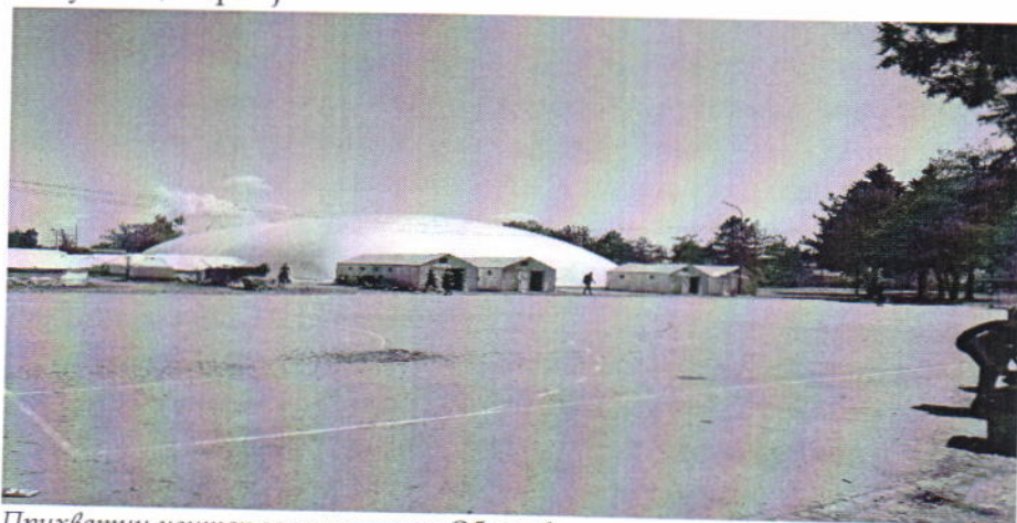
Прихватни центар за мигранте у Обреновцу

Имајући у виду материјалне услове у посећеним центрима, посебно преоптерећеност смештајних капацитета, услове за одржавање личне хигијене, неподобност шатора и других привремених објеката за дужи боравак особа у њима, НПМ је указао надлежним органима да овакво поступање у продуженом трајању кумулативно може достићи праг нечовечног и понижавајућег поступања. С тим у вези, НПМ је скренуо пажњу на чињеницу да уколико се у будућности наша земља суочи са новим таласом заразе, који ће евентуално захтевати увођење рестриктивних мера, надлежни органи, а пре свега КИРС, треба да предузму мере да смештајне капацитете растерете, односно да размотре могућност отварања нових прихватних центара како би се оптимализовао број смештених миграната, као и да предузму активности на унапређењу услова смештаја и боравка у свим центрима центрима како би се обезбедили услови за поштовање основних људских права миграната који ће у боравити у прихватним центрима у Републици Србији.