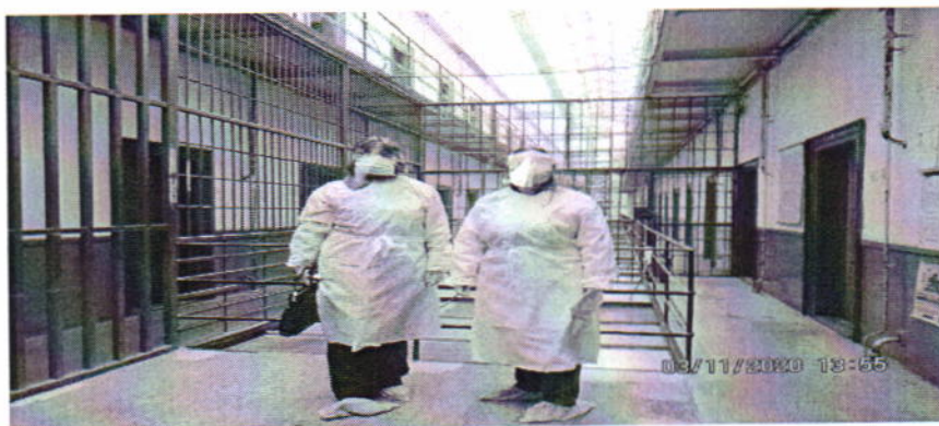
Тим НПМ у посети КПЗ Сремска Митровица

Поводом притужби већег броја осуђених лица на смештајне услове у IV павиљону у Казнено-поправном заводу у Сремској Митровици, а уједно и пратећи поступање по упућеној препоруци НПМ из 2012. године да се без одлагања приступи адаптацији тог павиљона с обзиром да не испуњава услове за смештај осуђених, НПМ је обавио контролну посету овом заводу. НПМ је утврдио да је објекат „IV павиљон“ у КПЗ Сремска Митровица пренасељен и да не испуњава услове за смештај осуђених у складу са важећим прописима и стандардима и с тим у вези упутио препоруке 30 . Препоруке се односе на то да се без одлагања предузму мере како би сва осуђена лица у том објекту имала обезбеђен смештај у складу са важећим прописима и стандардима. Такође препоручено је да се надаље у павиљон не разврставају осуђени у спаваонице, док се у њему не обезбеде прописани смештајни услови.