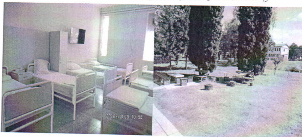
СБПБ „Др Славољуб Бакаловић“ у Вршцу и СБПБ „Горња Топоница“

Професионално поступање руководства и запослених током посета НПМ наведеним психијатријским болницама и Специјалној затворској болници у Београду, у постојећим епидемиолошким условима, представљало је пример добре праксе у поступању, у складу са законом предвиђеном обавезом сарадње органа са НПМ.