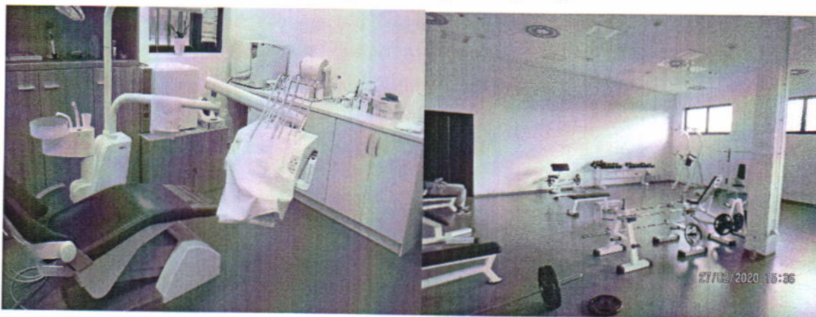
Стоматолошка ординација и теретана у КПЗ Панчево

Управа за извршење кривичних санкција наставила је да улаже у материјалне услове смештаја лица лишених слободe и повећање капацитета завода за извршење кривичних санкција, изградњом нових павиљона у Казнено-поправном заводу у Сремској Митровици, Окружном затвору у Лесковцу, а унапређени су материјални услови и у Окружном затвору у Новом Саду, Специјалној затворској болници, Окружном затвору Београд, Казнено-поправном заводу за жене у Пожаревцу.