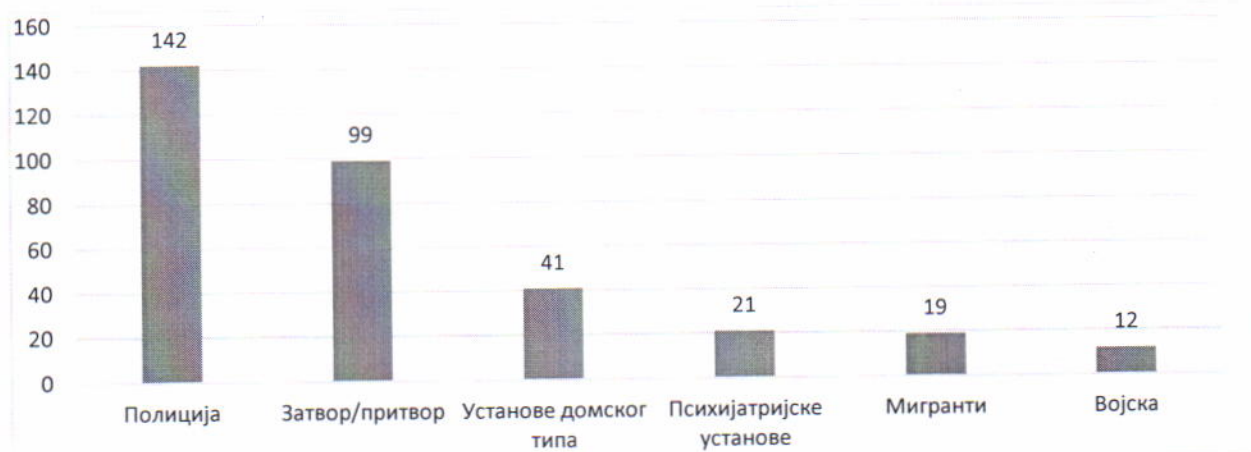
Графикон 2 - Упућене препоруке

Све препоруке упућене посећеним установама/надлежним министарствима у 2020. години налазе се у делу Извештаја – ДОДАТАК I.