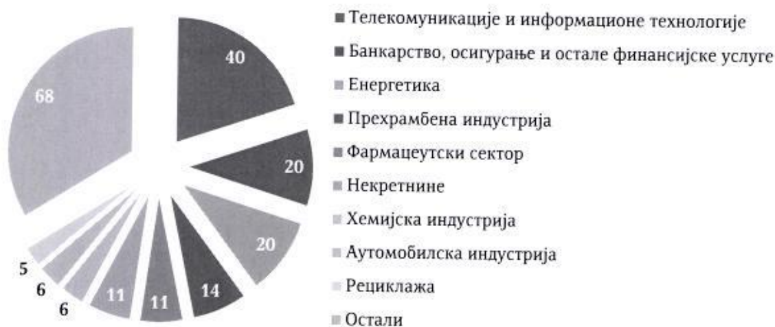
Графикон 6: Структура пословних активности у вези којих су подношене пријаве концентрација

Број поднетих пријава у 2019. години (201), као и концентрације које су реализоване на основу издатих одобрења Комисије за њихово спровођење током извештајног периода, указују на наставак растућег тренда заинтересованости страних инвеститора за улагање у српску привреду. Током 2019. године, дошло је до промене власништва над одређеним бројем домаћих привредних субјеката, приликом чега су њихови нови власници и контролори постале, непосредно или посредно, иностране компаније.