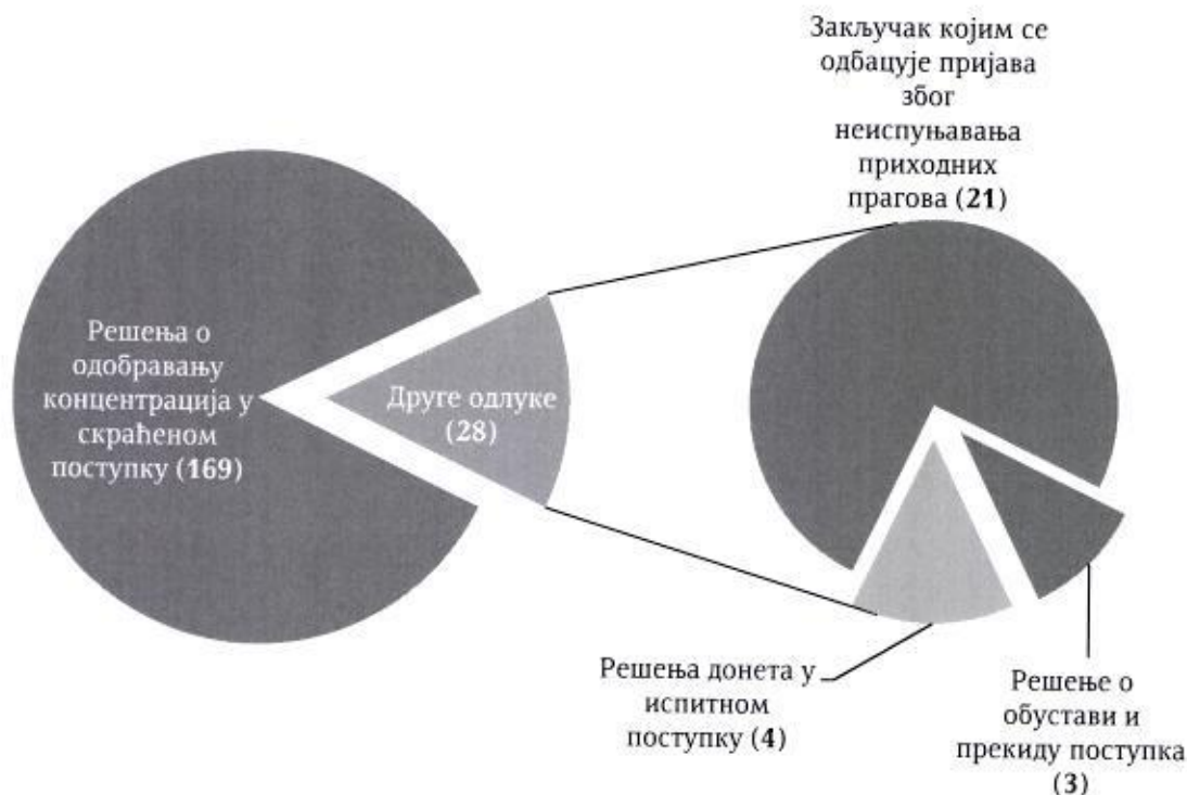
Графикон 3: Структура одлука којима се окончава поступање у сегменту испитивања концентрација

Током 2019. године, настављен је тренд раста броја пријављених концентрација, тако да је Комисија током извештајног периода примила до сада највећи број пријава концентрација, укупно 201, што у односу на претходну извештајну годину (2018) током које је поднето 171 пријава, представља раст од око 17,5%. Као и током претходне године, већина поднетих пријава (173, односно 86%) поднета је у скраћеном облику, у складу са чланом 3. Уредбе о садржини и начину подношења пријаве концентрације. Од укупног броја поднетих пријава у 2019. години (201), њих 134, односно 66,66%, поднето је од стране иностраних правних лица, док је 67 пријава концентрације (33,33%) поднето од стране домаћих правних лица, односно привредних субјеката – учесника на тржишту који су регистровани и активни на тржишту Републике Србије. Узимајући у обзир овај критеријум, структура подносилаца пријава поднетих током 2019. године остала је непромењена у односу на претходне године.